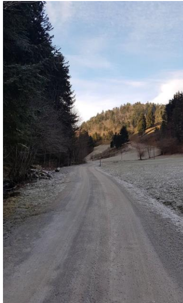
(Začetek tekaške proge)