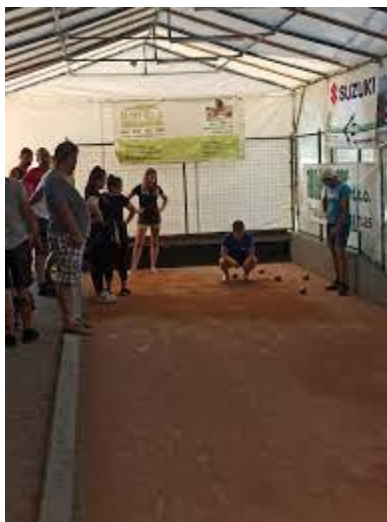
(Balinišče ob Gasilskem domu Sovodenj)

Vse potrebne rekvizite za igro baliranja bodo priskrbeli člani PGD Sovodenj.