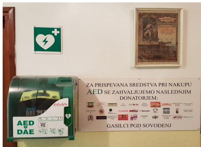
(Defibrilator v Gasilskem domu Sovodenj)