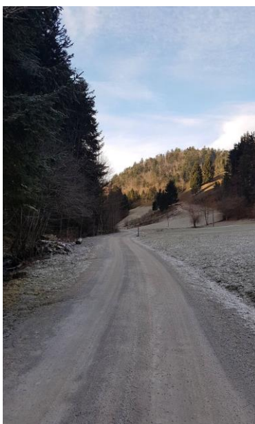
(Začetek tekaške proge)