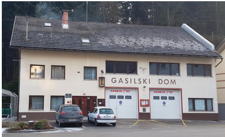
(Gasilski dom Sovodenj)