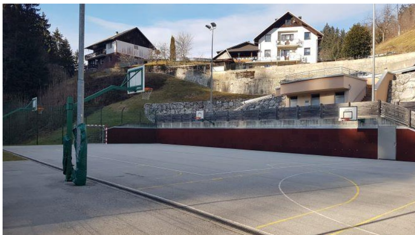
(Športno igrišče ob PŠ Sovodenj)