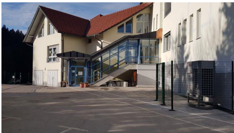
(Zbiranje udeležencev prireditve pred Podružnično šolo Sovodenj)