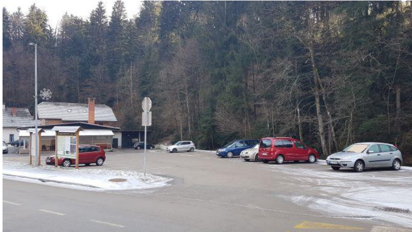
(Parkirišče na dnu Sovodnja)