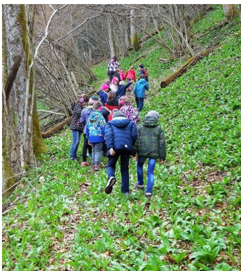
(Del orientacijske poti, arhiv PŠ Sovodenj)